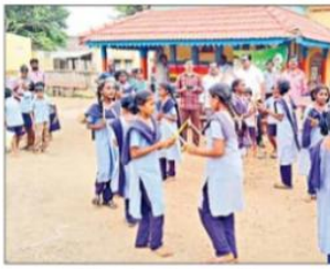
కోలాట ప్రదర్శనలో విద్యార్థులు