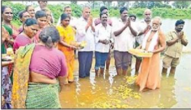
బొమ్మలూరులో చెరువుకు జలహారతి ఇస్తున్న మహిళలు, నాయకులు