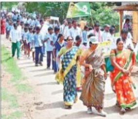
కౌతవరంలో ప్రదర్శన చేస్తున్న విద్యార్థులు