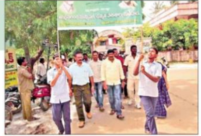
స్వచ్ఛతే సేవ చైతన్య ప్రదర్శనలో పాల్గొన్న విద్యార్థులు

చినలింగాల(నందివాడ), న్యూస్టుడే : ప్రతి ఒక్కరూ