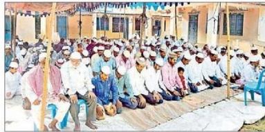
కౌతవరం చెక్ పోస్టు ఈడ్లా వద్ద ప్రార్థనలు చేస్తున్న ముస్లింలు

కౌతవరం(గుడ్లవల్లేరు), న్యూస్టుడె: పవిత్ర బక్రీద్ పర్వదినాన్ని మండలంలోని ముస్లింలు సంప్రదాయబద్ధంగా జరుపుకున్నారు. త్యాగానికి, దానానికి గుర్తుగా జరుపుకునే ఈ పండుగ సందర్భంగా ఉదయాన్నే ముస్లింలు సంప్రదాయ దుస్తులు ధరించి మసీదులు, ఈడ్లాల వద్ద ప్రత్యేక ప్రార్థనలు చేశారు. అనంతరం ఎవరి మొక్కుబడుల కోసం వారు గొర్రె పోతులను అల్లాకు సమర్పించారు. కౌతవరం ఒకటో వార్డు, చెలిపొట్ల, ఈడ్లా, చెరువుగట్టు, వేమవలపాలెం, నాగవరం, ఉలవలపూడి, టీమునిగుంట, సుట్టిచెర్వు, కట్టవారిచెర్వు, అంగలూరు, పెంజెంద్ర, డోకిపల్లె, లుకాపాడి గ్రామాల్లోని మసీదుల్లో ముస్లింలు ప్రార్థనలు చేశారు. చిన్నారులు పవస్వరం అలింగనం చేసుకుని శుభాకాంక్షలు తెలుపుకున్నారు. గుడివారు: మియాతాన్ మసీదు, గుల్షారీమసీదు.