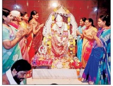
బాబాకు పూజలు చేస్తున్న మహిళా నిర్వాహకులు, భక్తులు