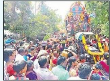
అమ్మవారికి సారె సమర్పిస్తున్న భక్తులు

కౌతవరం(గుడ్లవల్లేరు), న్యూస్ టుడే: శ్రావణ చివరి ఆదివారం పురస్కరించుకుని కౌతవరం ఒకటో వార్షికోత్సవంలో ఆదివారం శ్రీకనకదుర్గమ్మ తల్లి 106వ వార్షిక సంబరం నిర్వహించారు. 105 ఏళ్లుగా అమ్మవారి సంబరాలను పెద్దఎత్తున నిర్వహించడం ఆనవాయితీ. ఈ క్రమంలో ఆదివారం అమ్మవారి ఆలయం వద్ద సుంచి అమ్మవారి భారీ ప్రభును అలంకరించిన ట్రాక్టర్ పై ఉంచి మేకతాళాలు, డప్పు