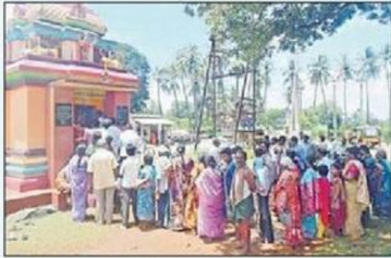
కౌతవరంలో గుడిముందు భక్తుల బారులు