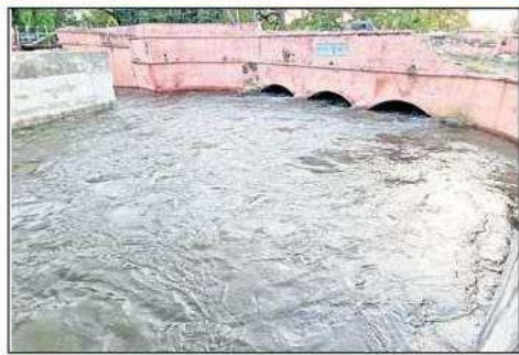
మూడు ఖానాలు నిండుగా ప్రవహిస్తున్న బంటుమిల్లి కాల్వ

కౌతవరం (గుడ్లవల్లేరు), న్యూస్ టుడే: తూర్పు కృష్ణాలో ప్రధానమైన 250 లక్షల ఎకరాలకు సాగునీరు దించే ఫుల్లేరు కాల్వ కౌతవరం లాకులు నీటితో కళకళ లాడుతున్నాయి సోమవారం జ్యూరేజీ వద్ద నీటిని విడుదల చేయగా మంగళవారం సాయంత్రం, బుధవారం నుంచే ఫుల్లేరు కాల్వ నిండుగా మారింది. గురువారం కౌతవరం లాకులకు 800 క్యూసెక్కుల నీరు చేరింది. ఈ నేపథ్యంలో బంటుమిల్లి కాల్వకు 218, పోల్ రాజ్ కు 228, క్యాంప్ బెల్ కు 10 క్యూసెక్కుల(బాలుడు గల్లంతు కారణంగా నీటిని నిలిపివేశారు) నీటిని విడుదల చేశారు. దీంతో కౌతవరం లాకుల పరిధిలోని 160 లక్షల ఎకరాల సాగుకు వీలుగా రైతులు