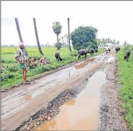
పీహెచ్ సీకి వెళ్లే రహదారి దుస్థితి ఇది

కౌతవరం(గుడ్లవల్లేరు), న్యూస్ టుడే : మండలంలోని కౌతవరం ప్రాథమిక ఆరోగ్య కేంద్రం చేవేంద్ర రహదారిలో ఊరికి కాస్త దూరంగా ఉంటుంది. పంచాయతీ కార్యాలయం పక్కనున్న మర్రిచెట్టు నుంచి ప్రారంభమయ్యే ఈ రహదారి అసుపత్రి వరకు దారుణంగా తయారైంది. 20 ఏళ్ల కిందట సినీనటుడు కైకాల సత్యనారాయణ ఎంపీగా ఉన్నప్పుడు తన స్వగ్రామమైన కౌతవరానికి చేసిన అభివృద్ధి పనుల్లో భాగంగా ఈ డొంక రహదారిని బీటీ రోడ్డుగా అభివృద్ధి చేశారు. నాటి నుంచి దీనికి పైసా నిధులు ఖర్చు చేయలేదు. ఫలితంగా అధ్వానంగా మారింది. అడుగుడుగున గోతులు, సగం కుంగిన రహదారిలో ప్రయాణికులు, రైతులు అనేక ఇబ్బందులు పడుతున్నారు. ఏడాదిన్నర కిందట ఈ