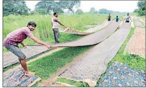
బంటుమిల్లి కాల్వలో దుస్తులు నానబెడుతున్న కార్మికులు, కాల్వ గట్టున దుస్తులు ఆరబెడుతూ..

బెట్టి ఆరబెడితేనే కలంకారీ వస్త్రానికి నాణ్యమైన రంగు, తుది రూపు వస్తుంది. అంటే మొత్తం ప్రక్రియలో నీరే కీలకపాత్ర. పెడన మధ్యగా ప్రవహించే రామరాజు కాల్వలోనే పెడన నేతకార్మికులంగా ఈ వస్త్రాలను ఉతికి ఆరబెట్టుకుంటుంటారు. నేడు గత కొన్ని నెలలుగా ఈ కాల్వలో నీటి సరఫరా సరిగా, పూర్తి స్థాయిలో లేక ఇబ్బందులు పడుతు