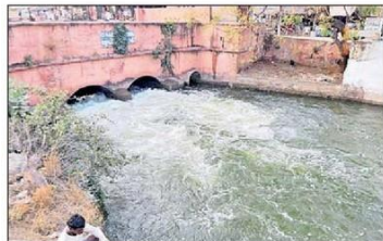
క్యాంప్ బెల్ లాకుల నుంచి నీటి పరతత్తు

కౌతవరం(గుడ్లవల్లేరు), న్యూస్ టుడే: తూర్పు కృష్ణాలో ప్రధానమైన కౌతవరం లాకులకు గురువారం నీరు చేరింది. తాగునీటి అవసరాల నిమిత్తం ప్రభుత్వం కౌతవరం కెనాల్ ద్వారా నీటిని సరఫరా చేసింది. జనవరి 10లో ఫుల్లేరుకు సరఫరా నిలిచిపోయింది. దీంతో గ్రామాల్లోని తాగునీటి చెరువు