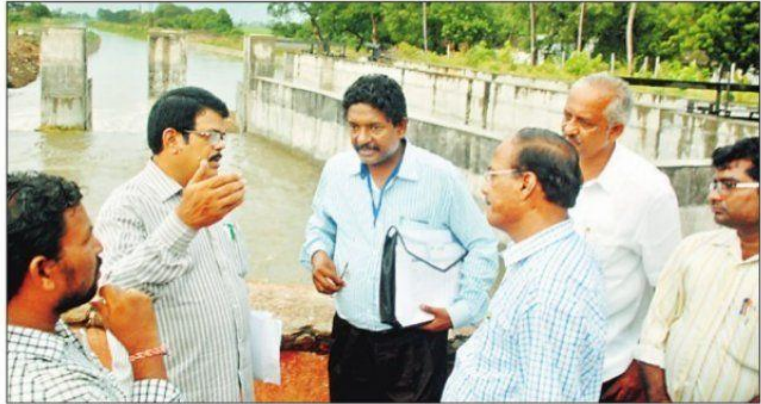
గుడ్లవల్లేరు లాకుల వద్ద ఇరిగేషన్ సీకా సుదాకర్ కు నీటి విడుదల తీరును వివరిస్తున్న డీఈ సి.వి. సత్యనారాయణ

గుడ్లవల్లేరు : కృష్ణాడెల్టాలో 50 శాతం వరి నాట్లు పూర్తయ్యాయని, మిగిలిన 50 శాతం కూడా నాట్లు పూర్తయ్యే వరకు నీటిని సరఫరా చేస్తామని కృష్ణాడెల్టా, ఫులిచింతల ఇరిగేషన్ సీకా సుదాకర్ తెలిపారు. గుడ్లవల్లేరు ఇరిగేషన్ డివిజన్ అధికారులతో శుక్రవారం ఆయన సమావేశమయ్యారు. క్యాంప్ బెల్, పోల్ రాజ్, బంటుమిల్లి లాకులకు పంపిణీ జరుగుతున్న నీటి వివరాలు, లోయర్ ఫుల్లేరుకు ఎంత నీరు అవసరం అనేవిషయమై ఇరిగేషన్ అధికారులతో ఆయన చర్చించారు. ఈ సందర్భంగా ఆయన విలేకరులతో మాట్లాడారు. కృష్ణా డెల్టాకు 10 వేల క్యూసెక్కుల నీటిని విడుదల చేసినట్లు ఆయన చెప్పారు. ఫులిచింతలకు 16 టీఎంసీలు రాగా, 8 టీఎంసీల నీటిని దిగువకు ఇచ్చేవామన్నారు. ప్రస్తుతం ఫులిచింతలలో 75 టీఎంసీల నీరు నిల్వ ఉంచామని ఆయన చెప్పారు. పైనుంచి గత రెండురోజులుగా నీరు రావడం ఆగిపోయిందని చెప్పారు. వర్షాలు పడితే ఫులిచింతల నీరు విడుదల చేయడం ఆపేస్తామన్నారు. వట్టిసీమ నీరు మాత్రం వస్తుందని ఆయన చెప్పారు. వర్షాభావం ఉంటే శ్రీశైలం నుంచి నీరు అడుగుతున్నామని, అవి వస్తే కృష్ణాడెల్టాకు ఎటువంటి నీటి ఎద్దడి ఉండదని ఆయనచెప్పారు. డెల్టాలో ప్రస్తుతం 11 లక్షల