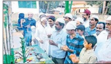
పూజలు చేస్తున్న ముస్లింలు

కొత్తవరం(గుడ్లవల్లేరు), న్యూస్ టుడే: మండలంలోని కొత్తవరం ఒకటో వార్డులోని మీనార్ మసీదులో శనివారం సాయంత్రం నుంచి రాత్రి వరకు జుండా పండుగ నిర్వహించారు. మహబూబ్ సుబానీ గ్యారీ జుండా పండుగ పేరిట దీనిని యువకులు నిర్వహిస్తున్నారు. మసీదులోని జుండాలను ఊరేగింపుగా తీసుకెళ్లి స్థానిక జుండా దిమ్మె వద్ద ఉంచి పూజా దికాలు చేసి మికాయిలు, చందనం సమర్పించారు. అనంతరం వాటిని చుట్టి చేశారు.