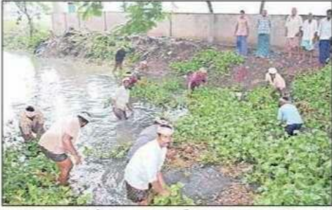
కాల్వలో డెక్క తొలగిస్తున్న రైతులు