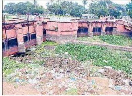
చెత్తచెదారంతో నిండిన కౌతవరం లాకులు

కౌతవరం (గుడ్లవల్లేరు), న్యూస్ టుడే : తూర్పు కృష్ణాలో సాగునీటి సరఫరాలో కీలకమైన కౌతవరం లాకులు అత్యంత దయనీయ దుస్థితికి చేరుకున్నాయి. 140 లక్షల ఎకరాలకు సాగు నీరుందించేందుకు ఏర్పాటు చేసిన ఈ కౌతవరం లాకులు చెత్తవెదారాలకు నిలయంగా మారాయి. కౌతవరం లాకుల నుంచి పోలరాజ్ కాల్వ(52 వేల ఎకరాలు), క్యాంప్ బెల్ కాల్వ(48 వేల ఎకరాలు), బంటుమిల్లి కాల్వ(60 వేల ఎకరాలు)ల ద్వారా