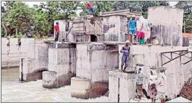
బంటుమిల్లి కాల్వలో కింద నీరు ప్రవహిస్తుండగా పైన నిర్మాణ పనులు

కొత్తవరం (గుడ్లవల్లేరు), న్యూస్ టుడే: మండలంలోని కొత్తవరం ప్రధాన లాకుల నుంచి ప్రవహించే మూడు బంటుమిల్లి పోల్ రాజ్ క్యాంప్ బెల్ కాల్వల్లో కొత్తగా హెడ్ రెగ్యులేటర్ నిర్మాణాలు చేశారు వీటిల్లో పోల్ రాజ్ క్యాంప్ బెల్ నిర్మాణాలు పూర్తికాగా బంటుమిల్లి కాల్వలో జరుగుతున్నాయి ప్రస్తుతం కాల్వలకు నీరు రావడంతో ఈ రెగ్యులేటర్ నిర్మాణం కూడా పూర్తి చేయాలనే లక్ష్యంతో పనులు చేస్తున్నారు ఈ రెగ్యులేటర్ కింద నుంచి నీరు ప్రవహిస్తుండగా పైన కాంక్రీట్ బాళ్ళు నిర్మిస్తున్నారు