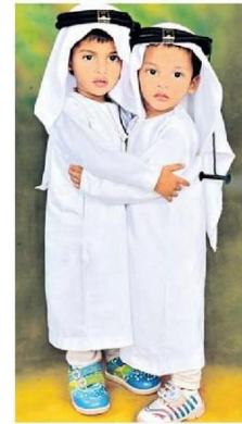
బక్రీద్ శుభాకాంక్షలు తెలుపుకుంటున్న చిన్నారులు