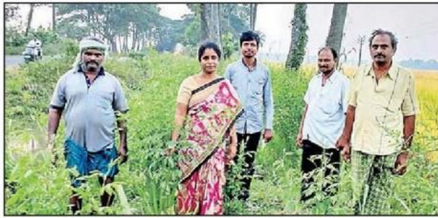
కంది పంటను పరిశీలించిన ఏవో రమాదేవితో రైతులు(పాతచిత్రం)

కంది విత్తనాలు ఇచ్చారు. అయితే ఉచితంగా ఇచ్చిన ఆ విత్తనాలను చాలా మంది రైతులు ఇంట్లో పప్పుగా వినియోగించుకున్నారు. దీనితో లక్ష్యం నీరుగారిపోయింది.