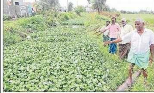
చెక్పోస్టు వద్ద కాల్వ దుస్థితిని చూపుతున్న రైతులు

కౌతవరం (గుడ్లవల్లేరు), న్యూస్టుడే: మండలంలోని కౌతవరం పరిధిలోని యడ్లకోడు పంటకాల్వలో దట్టంగా తూడు, గుర్రపుడెక్క పట్టిసింది ఫలితంగా సాగునీరు రాక రైతులు అవస్థలు పడుతున్నారు ఈ కాల్వను నీరు-చెట్టు పథకం కింద పొక్లెయిన్తో తవ్వారని పనుల పరిస్థితి ఇలా ఉందని రైతులు