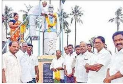
గౌతు లచ్చన్న విగ్రహానికి నివాళులర్పిస్తున్న గౌడ సంఘీయులు