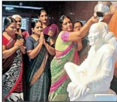
బాబా విగ్రహానికి క్షీరాభిషేకం చేస్తున్న ఆలయ నిర్వాహకులు