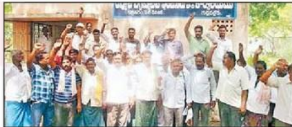
నిరసన వ్యక్తం చేస్తున్న గ్రామస్థులు, ప్రజాప్రతినిధులు

కౌతవరం(గుడ్లవల్లేరు),న్యూస్టుడే: తమ గ్రామాలకు తాగు నీరు ఇవ్వాలని కోరుతూ బంటుమిల్లి, కృత్తివెన్ను మండలాల గ్రామస్థులు వేడుకున్నారు. నైతులు, గ్రామస్థులు, ప్రజాప్రతినిధులు శనివారం మండలంలోని కౌతవరం నీటిపారుదల సబ్డివిజన్ కార్యాలయానికి చేరుకుని నిరసన తెలిపారు. శివారు గ్రామాలకు కాల్వల ద్వారా నీరు చేరలేదని, గ్రామస్థుల దాహార్తిని తీర్చే మంచినీరు వాడుక చెరువులకు వచ్చేలా కాల్వలకు నీటి సరఫరా పెంచాలని కోరారు. ఈ మేరకు డీఈఈ