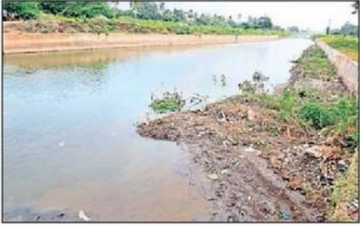
సరఫరా నిలిపివేయడంతో అడుగంటి ఉన్న బంటుమిల్లి కాల్వ

టుడే : సాగునీటి కొరతతో కాల్వలకు వంతుల వారీగా నీటి పంపిణీ నిర్వహిస్తున్నారు. తూర్పు కృష్ణాలో ప్రధానమైన కౌతవరం లాకుల నుంచి మూడు కాల్వలకు వంతులవారీ(వారా బందీ) విధానాన్ని అధికారులు అమలు చేస్తున్నారు. వచ్చే