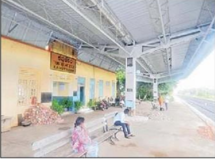
ఆధునికీకరించిన కౌతవరం రైల్వే స్టేషన్

కౌతవరం(గుడ్లవల్లేరు), న్యూస్ టుడే: మండలంలో కౌతవరం రైల్వే స్టేషన్ కౌతవరం సంతరించుకుంది. విజయవాడ నుంచి మచిలీపట్నం వరకు ఉన్న రైల్వే స్టేషన్ల ఆధునికీకరణ పనుల్లో భాగంగా దీనిని అభివృద్ధి