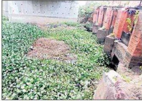
అధ్వానంగా ఉన్న పోలరాజ్ కాల్వ లాకులు

సాగునీటి క్రమబద్ధీకరణ జరుగుతోంది అయితే ఈ లాకుల నిర్వహణకు అధికార సిబ్బంది ఉన్నా ఈ లాకులు చెత్తచెదారంతో నిండిపోయాయి. పక్కనే ఉన్న పలు దుకాణాల గృహస్థుల చెత్త వృధా వస్తువులను మొత్తం తెచ్చి ఈ లాకుల్లోనే పోస్తున్నారు. గుర్రపు డెక్కకు తోడు ఈ చెత్త కూడా నిండిపోయి అసహ్యకరంగా మారింది. ఇప్పటికైనా తాగు నీటి సరఫరా కేంద్రమైన లాకులను పరిశుభ్రంగా ఉంచాలని రైతులు కోరుతున్నారు.