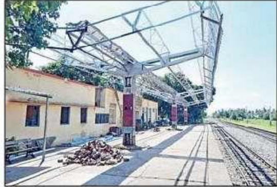
గడ్డర్లతో ఎత్తు పెంచిన రైల్వే స్టేషన్

కౌతవరం(గుడ్లవల్లేరు), న్యూస్ టుడే : మండలంలోని కౌతవరం రైల్వే స్టేషన్ లో అభివృద్ధి పనులు చేస్తున్నారు విజయవాడ నుంచి మచిలీపట్నం వరకు ఉన్న రైల్వే స్టేషన్ల ఆధునికీకరణ పనుల్లో భాగంగా కౌతవరం రైల్వే స్టేషన్ ప్లాట్