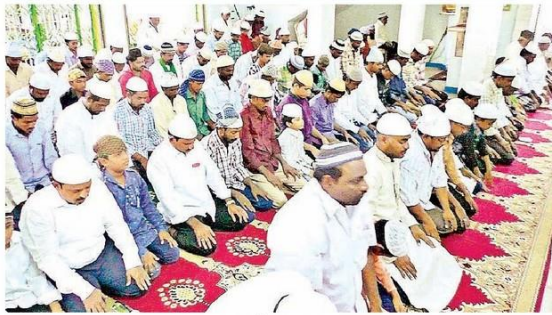
నమాజ్ చేస్తున్న భక్తులు