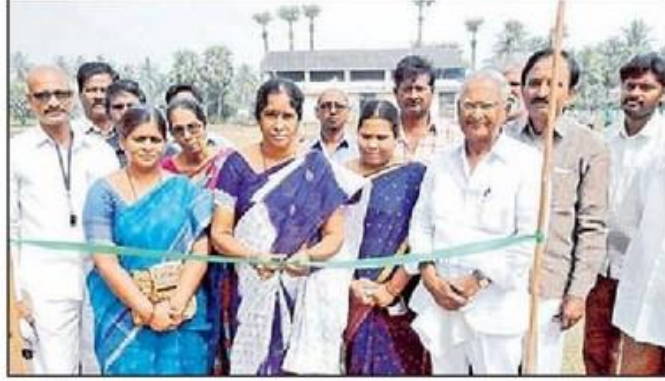
క్రీడాకీర్తులను ప్రారంభిస్తున్న పుష్పావతి, ఎంపీపీ

కౌతవరం(గుడ్లవల్లేరు), న్యూస్టుడే: గ్రామీణ క్రీడలకు కేంద్ర, రాష్ట్ర ప్రభుత్వాలు ఎంతో ప్రోత్సాహాలు అందజేస్తున్నాయని జడ్పీ ఉపాధ్యక్షురాలు శాయన పుష్పావతి పేర్కొన్నారు. శుక్రవారం మండలంలోని కౌతవరం జడ్పీ ఉన్నత పాఠశాలలో రెండు రోజుల పాటు