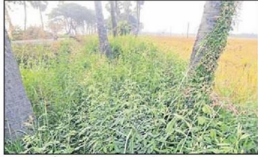
వరి చేల గట్లపై ఏపుగా పెరిగిన కంది మొక్కలు