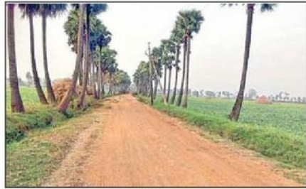
₹ 20 లక్షలో అభివృద్ధి చేయనున్న శృశానాల రహదారి