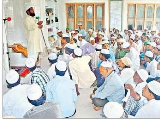
కౌతవరంలో ప్రసంగిస్తున్న మత పెద్ద హాజరైన ముస్లిం సోదరులు

కౌతవరం, డోకిపర్లు(గుడ్లవల్లేరు), న్యూస్టుడే : మండలంలోని పలు గ్రామాల్లో సోమవారం పవిత్ర మిలాద్ ఉన్ నబీ పర్వదినాన్ని వేడుకగా జరుపుకున్నారు. మహ్మద్ ప్రవక్త జన్మదినాన్ని పురస్కరించు