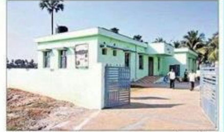
₹ 40 లక్షలతో నిర్మించిన కౌతవరం పీహెచ్సీ

అంతకు ముందున్నవి కొన్ని పాడైపోగా, రెండింటిని పాతా సుపత్రిలో ఆరోగ్య ఉపకేంద్రంగా మార్చి ఆక్కడే ఉంచే శారు. దీంతో కొత్త ఆసుపత్రిలో ఒక్క బెడ్ కూడా లేదు. రోగులు కూర్చునే రెండు పొడుగాటి ఇనుప బల్లల్ని ఒకటిగా కలిపి కట్టి దానిపై పాత చిరిగిన కొబ్బరిపీచును వేళారు. దాని పక్కనే పాతాసుపత్రిలో నాడు రోగుల్ని పరీక్షించేందుకు వాడిన ఎత్తు చెక్కబల్ల(దాతల వితరణ)నే తెచ్చి దానిపై తెల్ల వస్త్రం వేసి మంచంగా వినియోగిస్తున్నారు. వీటిపై పడుకోవడానికి రోగులు భయపడుతుంటే కొందరిని వరండాలోని సిమెంట్ చప్పాస్త్రం ఉంచి గెల్లెన్లు ఎక్కిస్తున్నారు. ఇప్పటికైనా నిధులను వినియోగించి రోగులకు సౌకర్యాలను కల్పించాలని ఫలువురు కోరుతున్నారు.