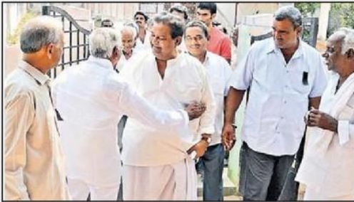
గ్రామస్థులతో చర్చిస్తున్న సినీనటుడు సత్యనారాయణ (దాదిన చిత్రం)

డంతో సాంకేతిక, పరిపాలనామోదం లభించింది. దీంతో నిధులు మంజూరు చేస్తూ పంచాయతీ రాజ్ కమిషనర్ ఉత్తర్వులు జారీ చేసినట్లు సుబ్రహ్మణ్యం చౌదరి వెల్లడించారు. టెండర్లు కూడా పూర్తయ్యాయని వివరించారు.