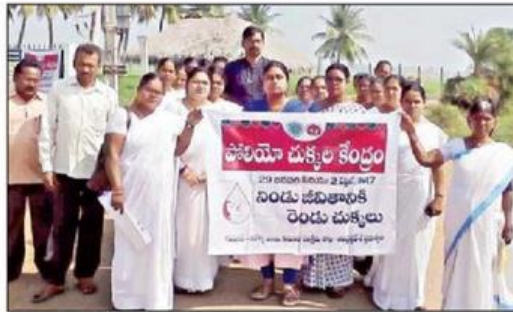
కౌతవరంలో ర్యాలీ చేస్తున్న వైద్యసిబ్బంది

గుడ్లవల్లేరు: మండలంలోని 22 గ్రామ పంచాయతీలకు చెందిన 3342 మంది చిన్నారులకు ఆది