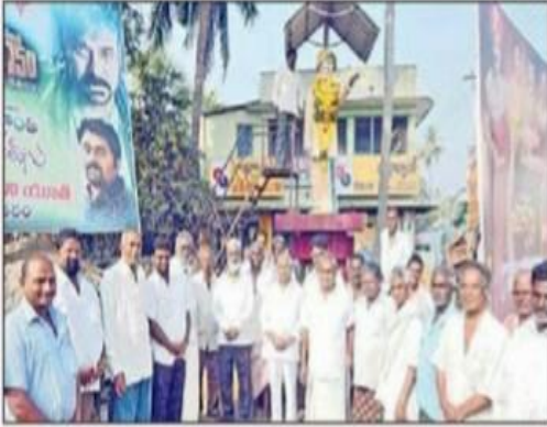
కౌతవరంలో ఎన్టీఆర్ విగ్రహం వద్ద నివాళులర్పిస్తున్న తెదేపా నేతలు