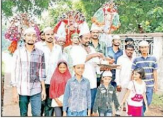
పీర్లను ఊరేగిస్తున్న ముస్లింలు